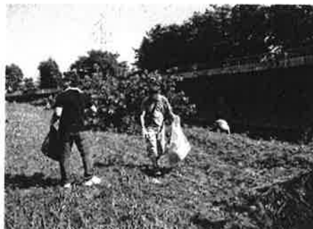
地元境川クリーンアップ作戦に参加