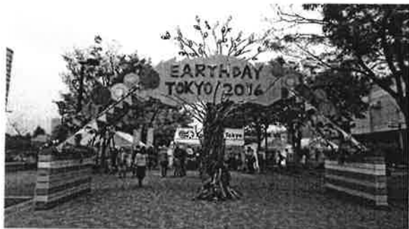
アースディごみゼロステーションに参加