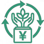
環境を守るための 投資

環境保全のために発行される 「東京グリーン・ブルーボンド」 「さがみはらグリーンボンド」に 投資しています。