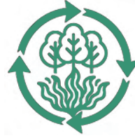
ブルーカーボン・ グリーンカーボン